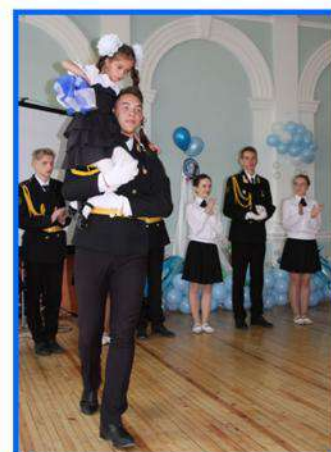
Фото на память сделано.