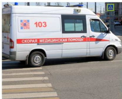
Фельдшер скорой помощи