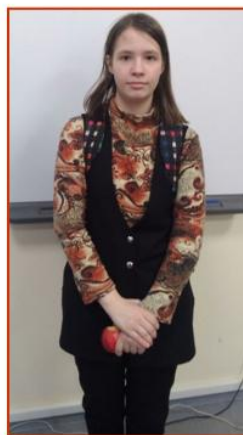
Автор: Ирина Страшникова, 9а класс

Праздник фестиваля. Сакуры цветы. Фонари сияют, Яркие огни.